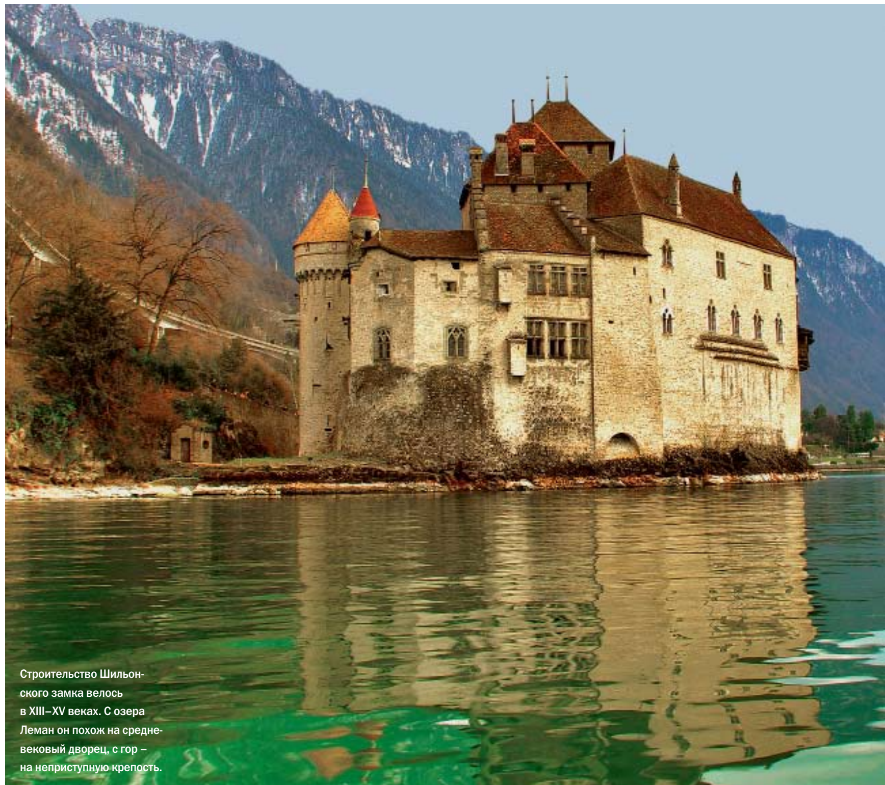
Строительство Шильонского замка велось в XIII–XV веках. С озера Леман он похож на средневековый дворец, с гор – на неприступную крепость.

Шильонский замок стал знаменитым, после того как холодным летом 1816 года здесь появился лорд Байрон, путешествовавший по Европе. А позже миру явилась поэма «Шильонский узник», в основу которой легла реальная история некоего Франсуа Бонивара, выступившего в XVI веке против могущественного Карла III Савойского и заточенного за это на шесть лет в подземелье Шильона. Так замок, благодаря Байрону, обрел свою легенду.