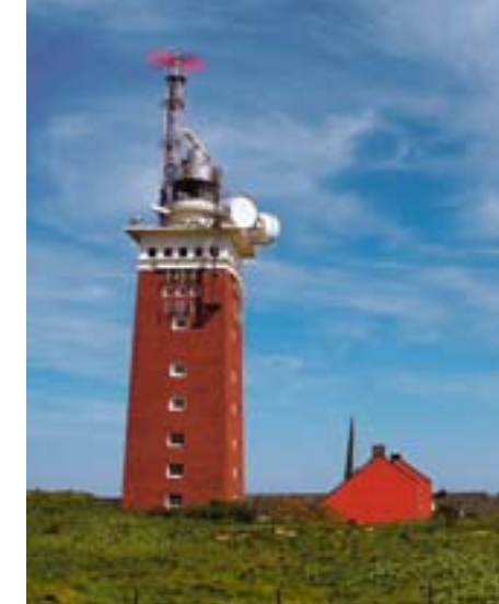
Маяк на Хельголанде – один из самых мощных на всем побережье Северного моря

ОСТРОВ можно обойти пешком по периметру за полтора-два часа. Пройдя похожую на клешню лобстера железобетонную гавань Зюдхафен, разноцветные домики местных рыбаков и торговцев сувенирами, попадаешь в район Унтерланд, где расположены самые дорогие на острове отели, рестораны и магазины. Прогулку можно продолжить до Нордостланда, искусственной части острова, созданной нацистами в конце 1930-х годов. Инженеры Третьего рейха хотели превратить эту часть гавани в самый большой в мире океанский порт, который мог бы вместить весь немецкий флот. Секретный