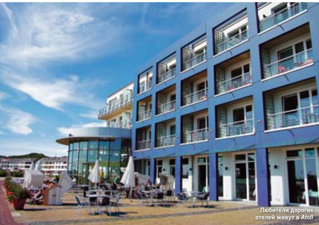
Любители дорогих отелей живут в Atoll