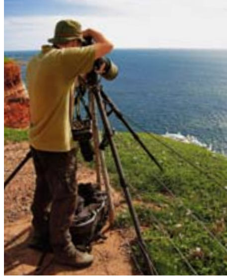
Фотографы-профессионалы составляют значительную часть прибывающих на остров туристов

ОБОЙДЯ справа церковь, старое кладбище и единственное на острове живое дерево, пережившее все взрывы, – черную шелковицу, возраст которой оценивают в 240 лет, попадаешь к маяку, одному из самых мощных в Северном море с лампой в две тысячи ватт, вспыхивающей каждые пять секунд. Сразу же за маяком начинается удобная тропинка длиной три километра, тянущаяся по краю