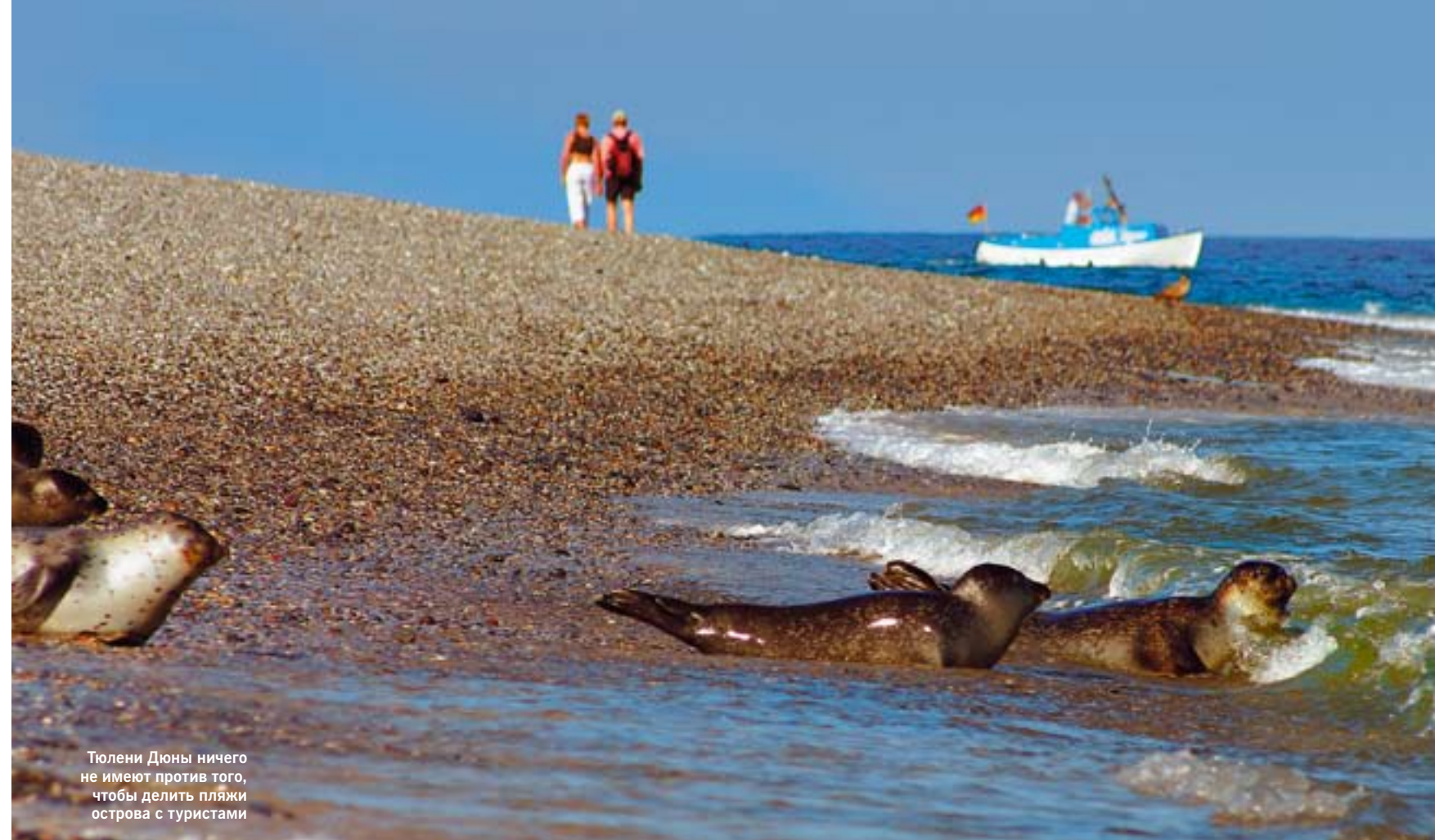
Тюлени Дюны ничего не имеют против того, чтобы делить пляжи острова с туристами