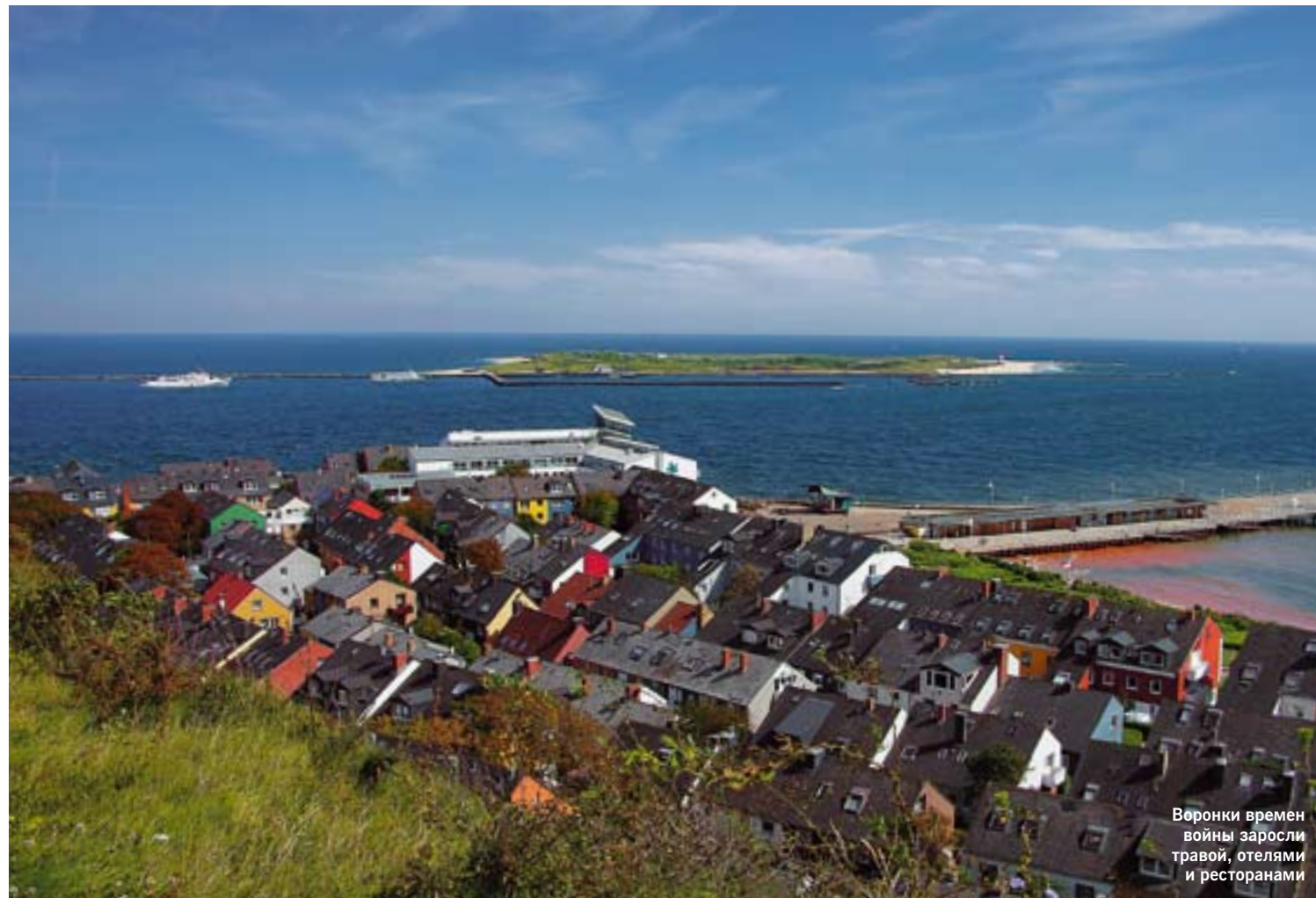
Воронки времен войны заросли травой, отелями и ресторанами