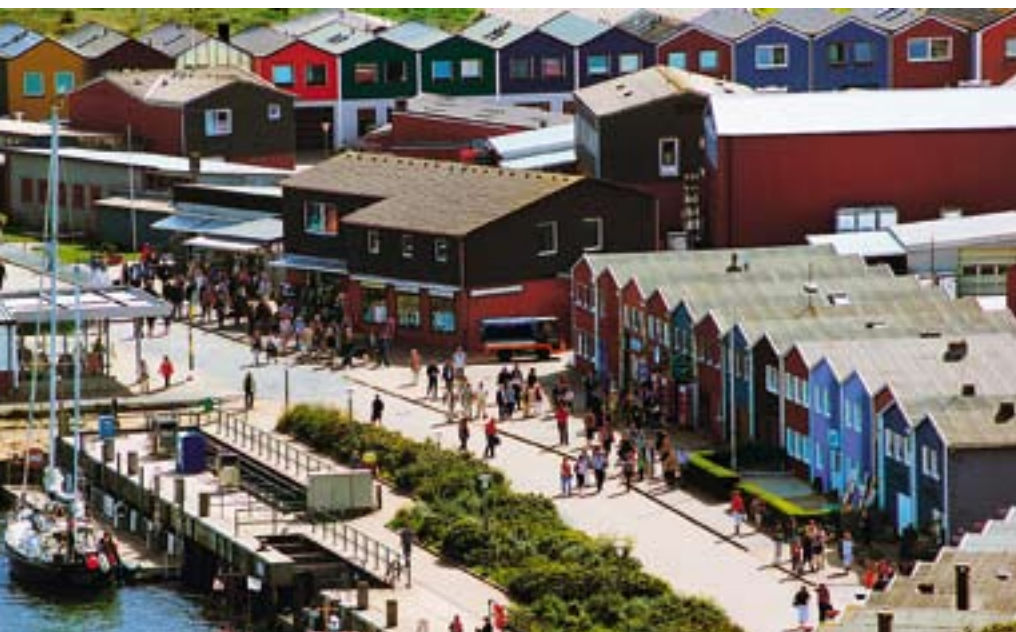
Район Унтерланд лучше всего подходит для того, чтобы пообедать в хорошем рыбном ресторанчике и купить сувениры

Боевое прошлое Хельголанда с трудом разглядит в его курортном настоящем даже наметанный глаз